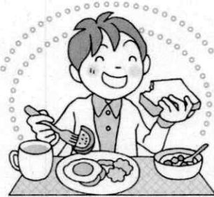
あさ た 朝ごはんを食べる