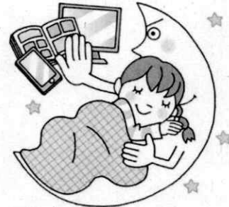
よ 夜ふかしをしない