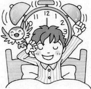
まいにちおなじかん お 毎日同じ時間に起きる